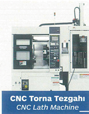
CNC Torna Tezgahı CNC Lath Machine