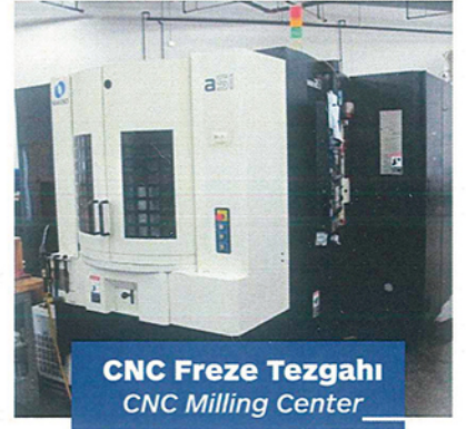
CNC Freze Tezgahı CNC Milling Center