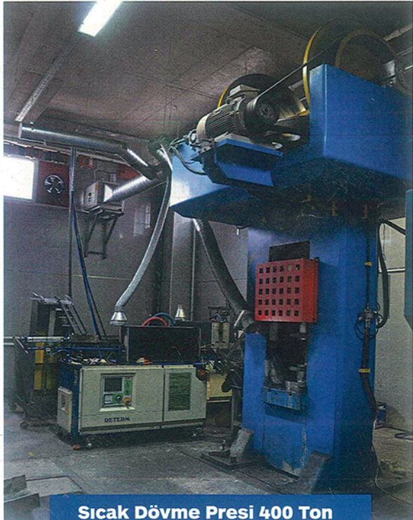
Sıcak Dövme Presi 400 Ton Hot Forging Press 400 Ton