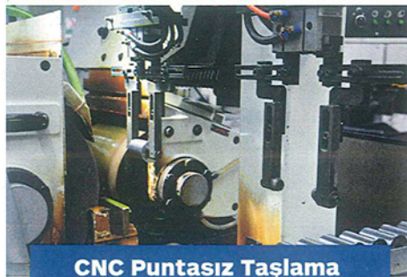
CNC Puntasız Taşlama CNC Centerless Grinding